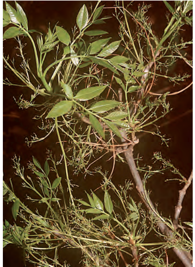
Abb. 3: Das Vorhandensein der Pennsylvanischen Esche ( Fraxinus pennsylvanica ) am Mittellauf der Elbe war – zumindest in der Forstwirtschaft – lange bekannt, ihr Verdrängungspotenzial wurde aber vom Naturschutz erst so spät realisiert, dass Sofortmaßnahmen hier bereits schwierig erscheinen. Trotzdem können diese Erfahrungen für andere Gebiete eine wertvolle Grundlage für Vorsorge- und Sofortmaßnahmen sein.