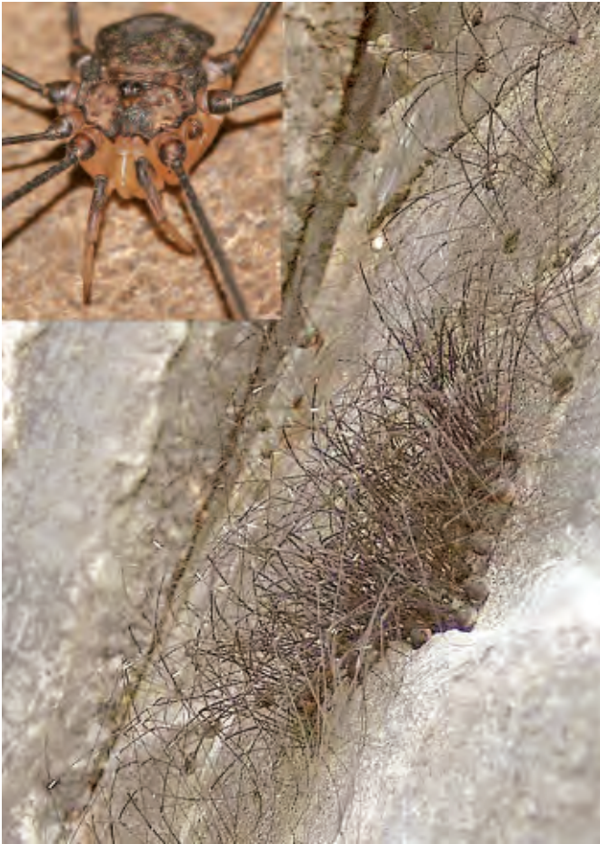
Abb. 2: Ein bisher nicht bestimmter „Riesen-Weberknecht“ aus der Gattung Leiobunum wurde 2004 erstmals in den Niederlanden und anschließend an einigen Stellen im Ruhrgebiet, in Rheinland-Pfalz und im Saarland gefunden (WIJNHOFEN et al. 2007). Obwohl negative Auswirkungen auf andere Arten, insbesondere Weberknechte, angenommen werden, dürfte der Fund vielen Naturschützern bisher unbekannt sein, da kein Meldesystem für neu auftretende, potenziell invasive Arten besteht.